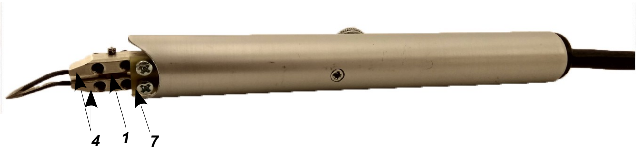
Рис. 2. Инструмент с установленной перемычкой.

Обозначение составных частей инструмента: